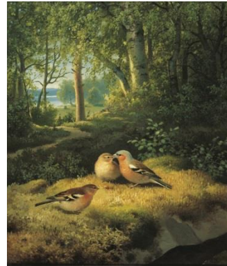
F. von Wright, Peippoja metsäaukiolla (1891)